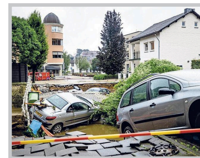
Het water hield ook flink huis in Valkenburg, waar een brug over de Geul bezweek onder het natuurgeweld.